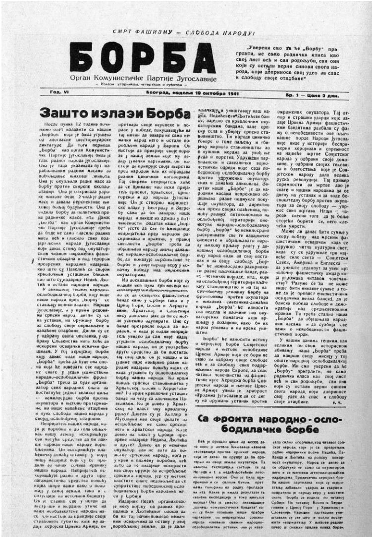
Slika 1. Faksimil prve stranice prvog broja Borbe , tiskan 19. listopada 1941. u Užicu, s uvodnim Titovim člankom „Zašto izlazi ‘Borba’”

Među prvim radovima u kojima je Tito pisao o Drugome svjetskom ratu nalazi se njegov politički referat na Petroj zemaljskoj konferenciji (jesen 1940.), koji se dobrim dijelom bavio upravo poviješću KPJ te jedan članak objavljen u glasilu CK KPH Srp i čekić . 18 Prvi tekstovi nastali nakon Travanjskog rata i okupacije Jugoslavije objavljeni su dok je Tito još boravio u Zagrebu i Beogradu. Radio se o nekoliko članaka objavljenih u Proleteru (tekst o savjetovanju KPJ održanom u svibnju 1941. u Zagrebu koji, zanimljivo, nije bio uvršten