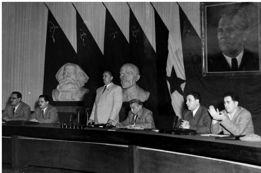
Slika 4. Peti kongres KPJ 1948. S desna na lijevo: Milovan Đilas, Aleksandar Ranković, Moša Pijade, Josip Broz Tito, Edvard Kardelj, Franc Leskošek Luka

odnosno ističe se kako su narodi Jugoslavije stupili u borbu i prije poziva Kominterne od 22. lipnja 1941. 158 Zašto je tomu tako, Tito je u referatu izravno i objasnio: