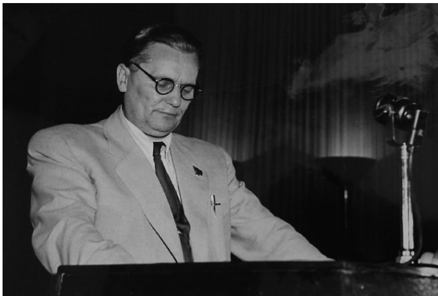
Slika 3. Josip Broz Tito čita referat na Petom kongresu KPJ

označivši to „revolucionarnim putem koji još nije dovršen”. Tu je tvrdnju u potpunosti razradio u vrijeme sukoba sa SSSR-om. 149