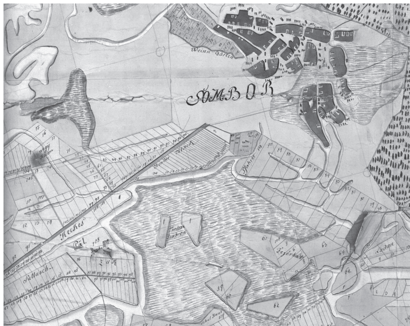
Sl. 3 Zemljišni posjedi u okolici Sombora na urbarijalnom planu iz 1783.