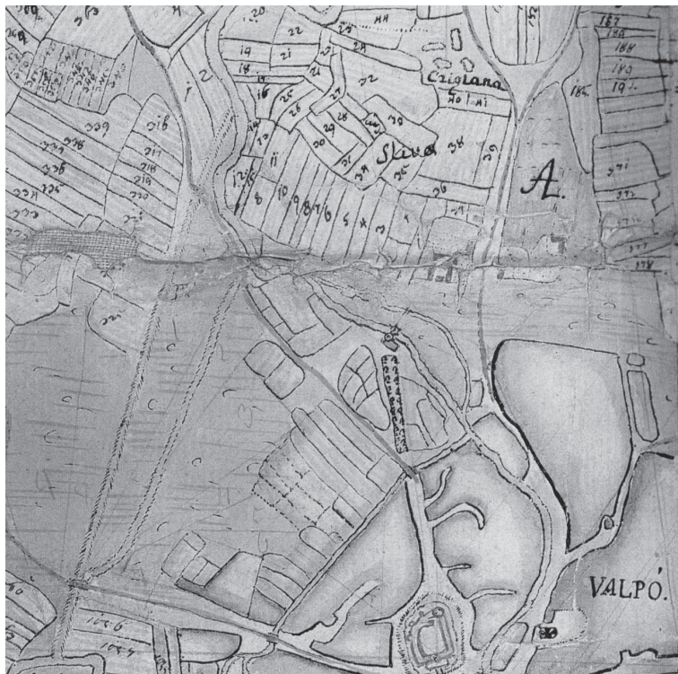
Sl. 2 Isječak urbarijalnog plana valpovačkog vlasništva iz 1774. godine