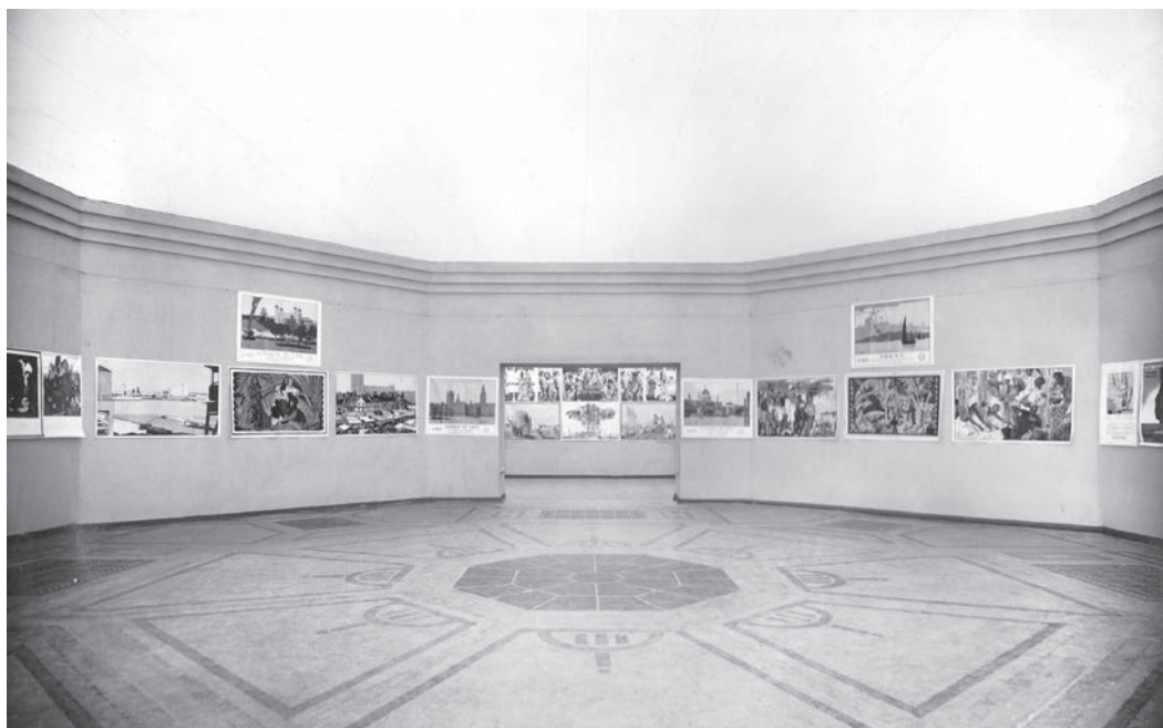
Sl. 2. Postav „Izložbe suvremene britanske umjetnosti“ u Umjetničkom paviljonu, 1928.

vrijedi spomenuti kako se među malobrojnim umjetnicama našla i slikarica Vanessa Bell 59 , sestra Virginije Woolf, poznata po atmosferskim mrtvim prirodama s raskošnim cvjetnim buketima.