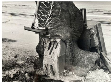
Antun Maračić: Stablo , Zagreb, 1997.