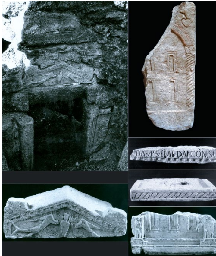
Sl. 1. Kasnoantička presvođena grobnica s inkorporiranim ulomcima rimskih osuarija, Groblje sv. Ive, Livno

cima kamenih osuarija s nekropola koje su na lokalitetima prethodile ranokršćanskim bazilikama. S ovih lokaliteta na Livanjskome polju prezentirat će se pojedinačni primjerci ponovne upotrebe spomenika s ciljem da se istraže mogući novi konteksti te kako se u kasnoj antici pristupalo tom fenomenu na lokalnoj razini.