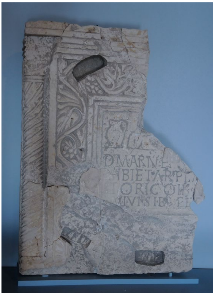
Sl. 3. Stela, Podvornice, Lištani (Foto: M. Marić Baković)

upotrijebljena kao dio ranokršćanskog liturgijskog namještaja, čemu u prilog ide i mjesto nalaza na lokalitetu. Jedna od pretpostavki bila je da se radi o prenamjeni u postolje za oltarnu menzu. Prema rasporedu utora, to bi značilo da je menza ležala na šest stupića što nije uobičajeno, naime najstarijim i najčešćim tipovima ranokršćanskih oltara pripadaju oltari s četiri stupića. Također, utori svojim oblikom ne odgovaraju profilu stupića koji bi nosili menzu. Druga i vjerojatnija je pretpostavka da je stela prenamijenjena u dio konstrukcije za ranokršćanski ambon. Raspored utora bi mogao odgovarati zaobljenim pločama koša ambona. Dimenzije udubljenja su: dužina 12, 5 cm, širina 5, 5 cm i dubina 5, 5 cm. Ukoliko se radi o prenamjeni za konstrukciju ambona, udubljenja su mogla biti za metalne spojnice. O prenamjeni stele svjedoči i naknadno uklesana L-profilacija dužine 16 cm, što bi odgovaralo mogućnosti uglavljivanja u određenu konstrukciju. Stela je mogla biti prenamijenjena u postolje za ploče koša ambona ili u neki drugi dio. Pretpostavljamo da je bočni dio stele s tordiranim polustupićem i biljnom dekoracijom bio vidljiv te iskorišten dekorativno. Ulomci ranokršćanskog liturgijskog namještaja na lokalitetu nađeni su jako usitnjeni te je teško izdvojiti ulomke koji bi eventualno pripadali dijelovima reljefnog ukrašenog ambona.