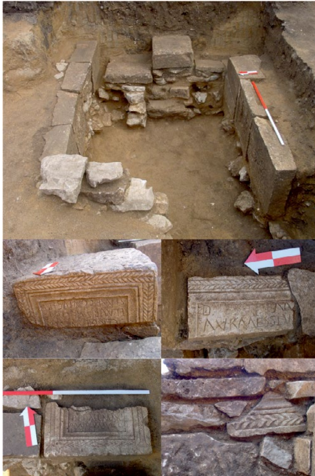
Sl. 2. Kasnoantička grobnica br. 5 obložena ulomcima rimskih osuarija, Podvornice, Lištani

arhitektonskim motivom porta Inferi uzidan je u pročelje iznad ulaza. Dio donjeg dijela poklopca osuarija s natpisom nađen je uzidan u pretprostor grobnice broj 2. Izgleda da se radi o donjem dijelu poklopca osuarija čiji je gornji dio ugrađen u pročelje kao pseudo zabat. Pretpostavljamo da se radi o ulomcima najmanje dva do tri različita osuarija monolitnog tipa 3 koji su s namjerom lomljeni te ugrađivani na način da se vodilo računa o konstruktivno-dekorativnoj ulozi ubačenih ulomaka. Rimska nekropola s koje su ulomci uzimani vjerojatno je ranije bila smještena na istraživanom dijelu lokaliteta ili u neposrednoj blizini i to uz put koji je ulazio u nekadašnje antičko naselje. Ranokršćanski kompleks vjerojatno je preslojio ostatke rimske nekropole s prevladavajućim obredom incineracije. 4 Dvije ranokršćanske grobnice kasnije su provaljene i opljačkane. U obje grobnice nađeno je po desetak kostura, a u grobnici broj 2 naknadno je kroz provaljeni svod izvršen ukop iz starohrvatskog razdoblja s poganskim značajkama ukapanja. 5